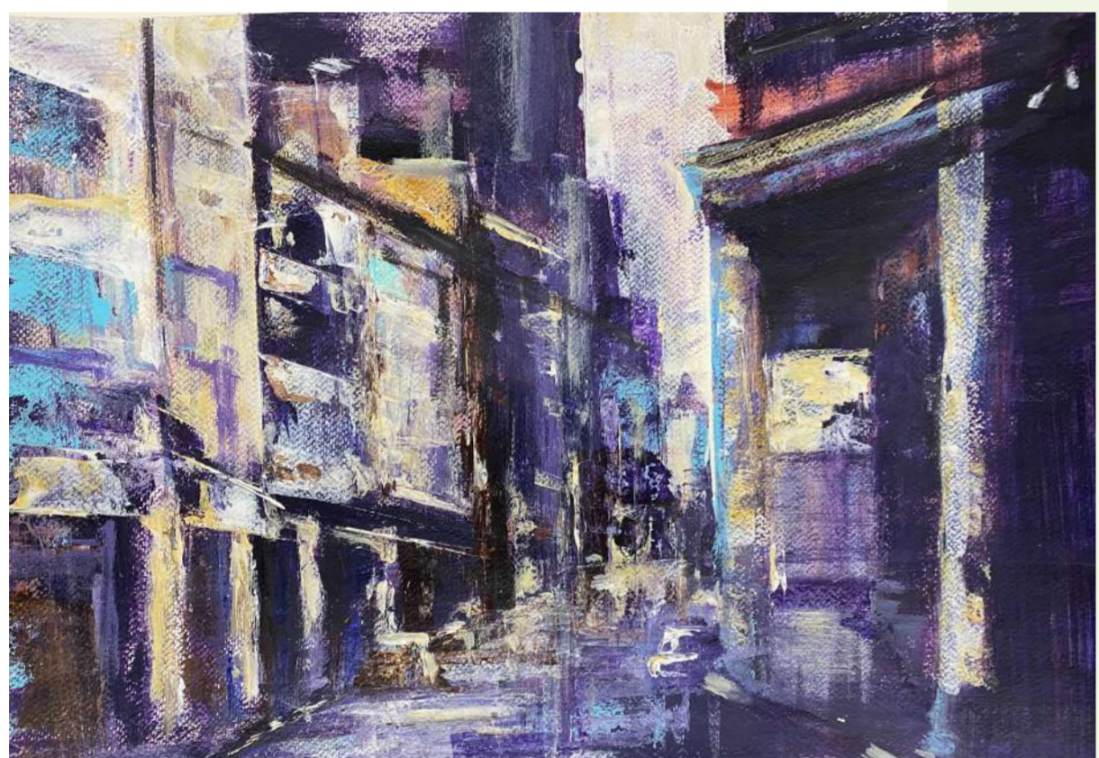
(2021) 第二名 復興商工 呂斌諺