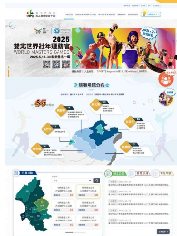
臺北市志工管理整合平台