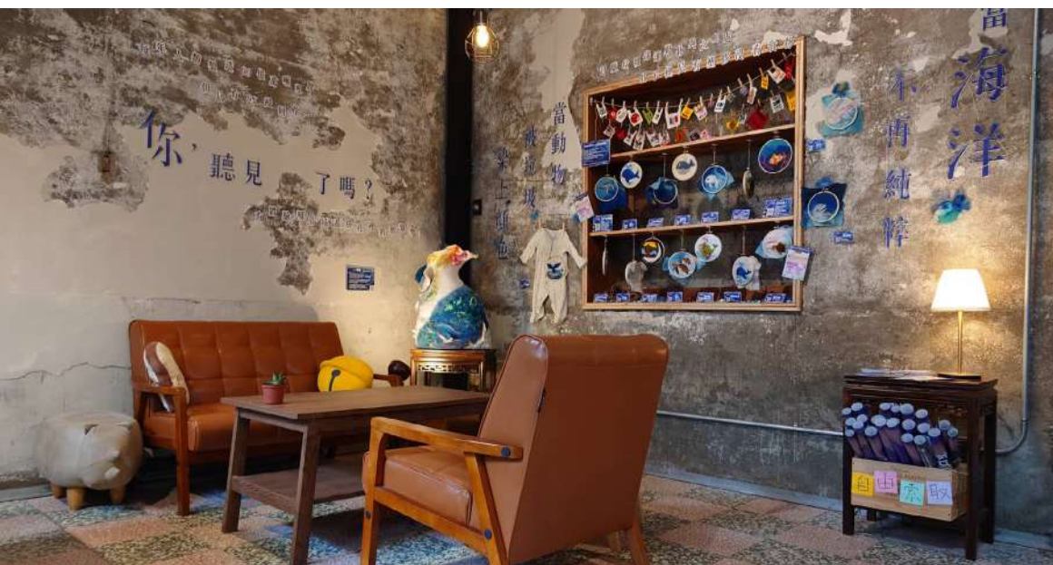
◀ 大觀小弄與賈桃樂學習主題館合作傳遞環保議題