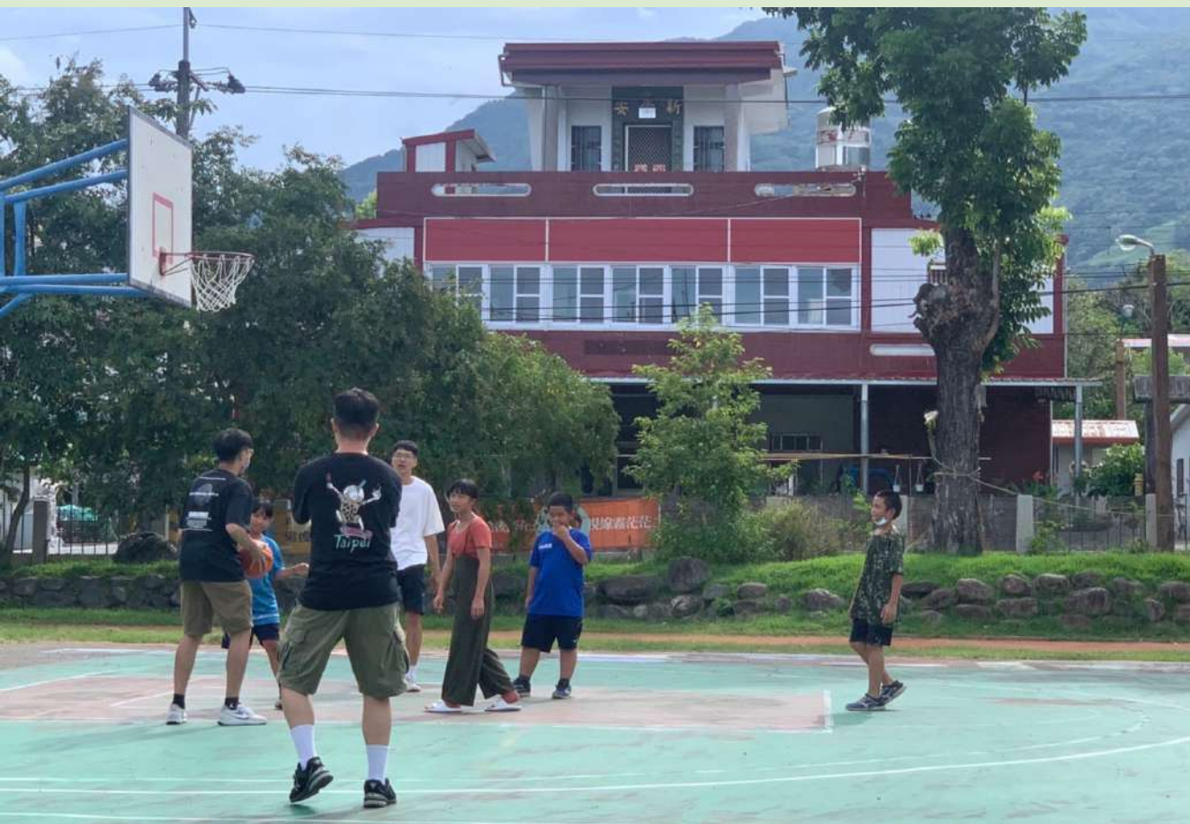
◀ 下課時間小朋友們與大哥哥們的籃球時光

聊天的過程當中，小朋友們提到自己很會打籃球，言語之間難掩他們對籃球的喜愛。「我們打籃球很厲害嘞！」「真的哦，我們有哥哥是打系籃的！」「那我們來比賽吧！」被小朋友拉著手，帶到了籃球場，下課的時光，變成了體育課，大家一起打起了籃球。