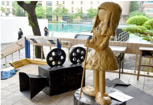
▲場邊佈置--小金人、攝影機