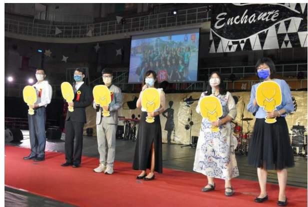
▲畢業班導師代表《六月天》致詞