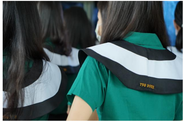
▲2022年 TFG 限定版畢業領巾