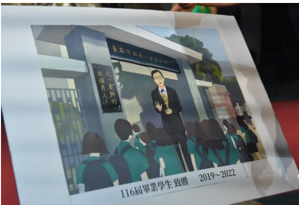
▲116 屆畢業生獻給校長的特製拼圖