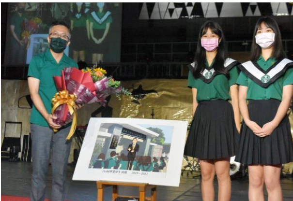
▲北一班聯主副主席代表獻花給校長