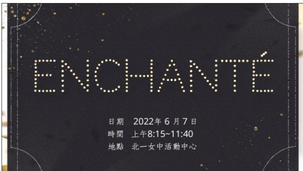
▲北一女中 80 屆畢業典禮邀請卡