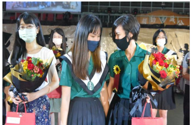
▲畢業生代表獻花給導師