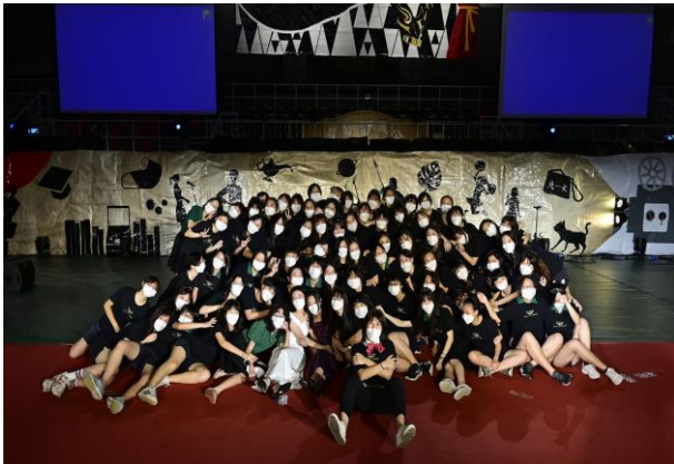
▲北一畢籌八零屆 Bling Bling