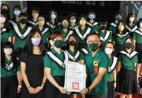
▲校長頒發畢業證書