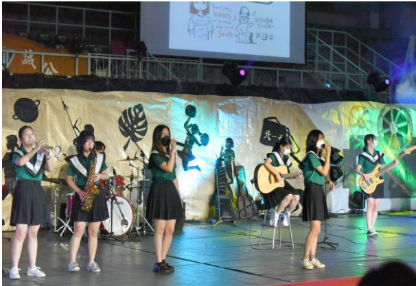
▲畢業歌《爆炒十八歲》Live Band 表演