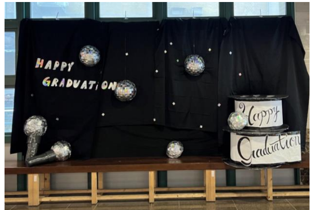
▲場邊佈置--Disco 球、麥克風