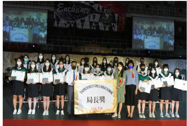
▲畢業生頒獎-局長獎