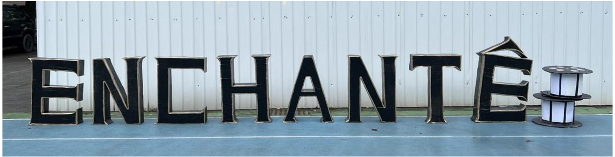
▲北一女 80 屆畢業典禮《Enchanté》See you later