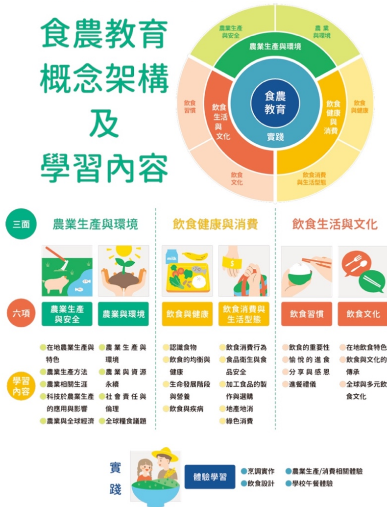
圖 1 食農教育 ABC 模式：食農教育三面六項