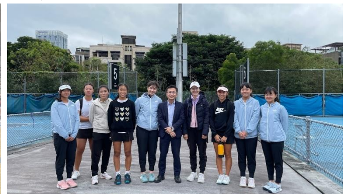
網球隊參加臺北市教育盃賽事