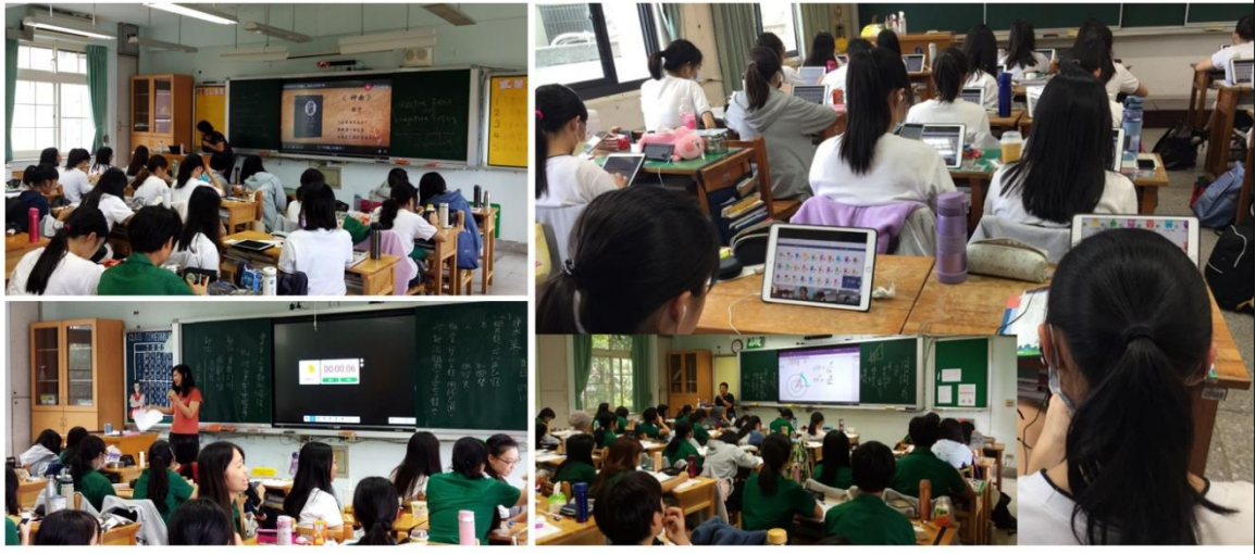
班班有大屏、一生一平板