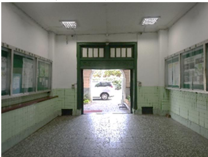
一樓入口處(修復前)