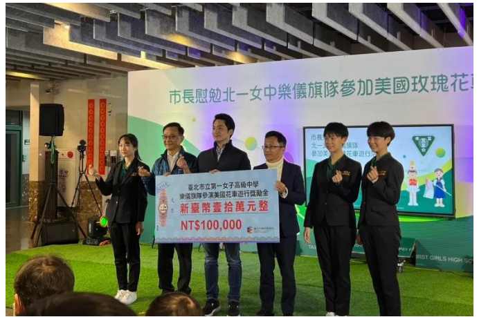
蔣萬安市長慰勉樂儀旗