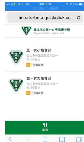
智慧點餐系統實際運作