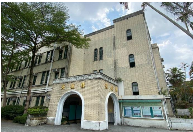
第一期外牆(修復前)