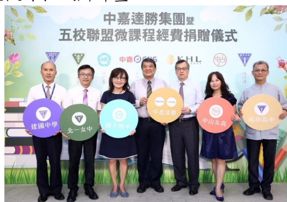
五校微課程經費捐贈儀式