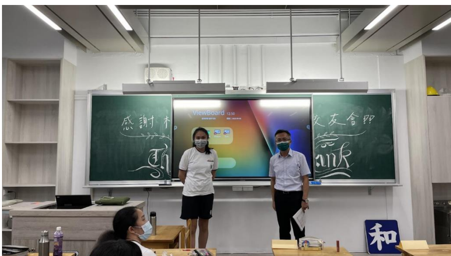
班級教室資訊設備更新