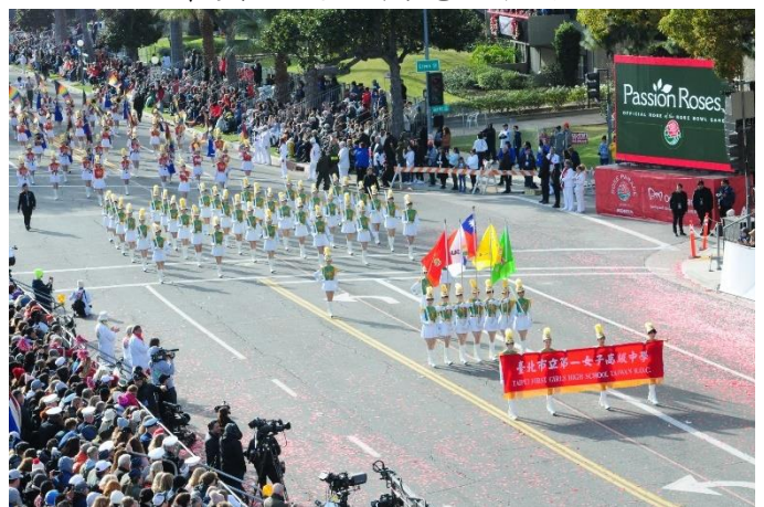
2023美國玫瑰花車遊行