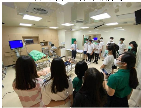
長庚醫學系微課程