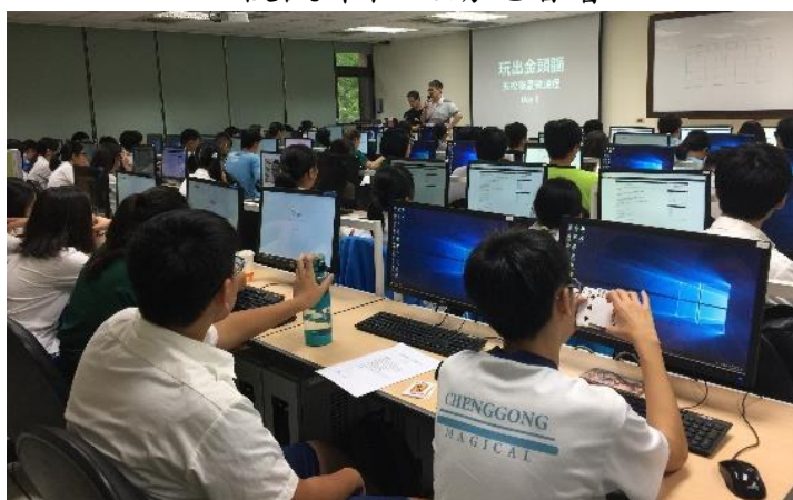
台大資工系微課程