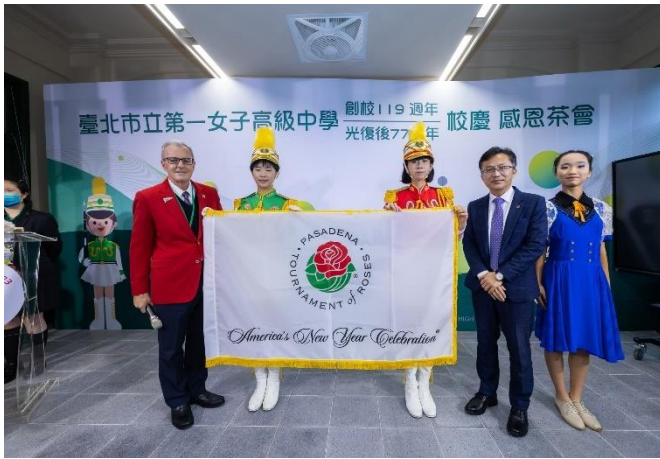
玫瑰花車主席來台授旗