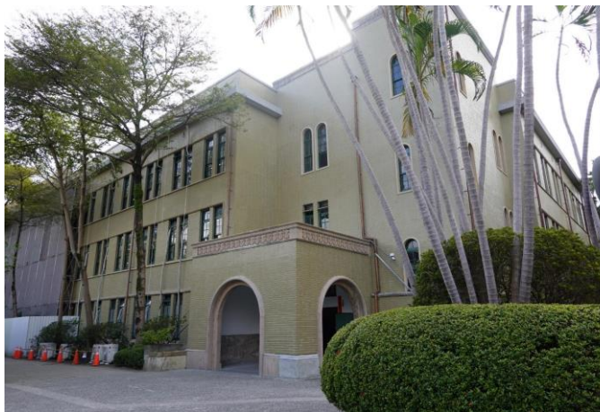
第一期外牆(修復後)