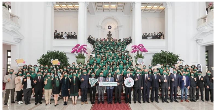
蔡英文總統接見、授旗