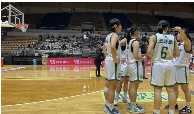
籃球隊參加HBL高中甲級聯賽