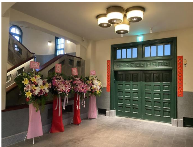
一樓入口處(修復後)