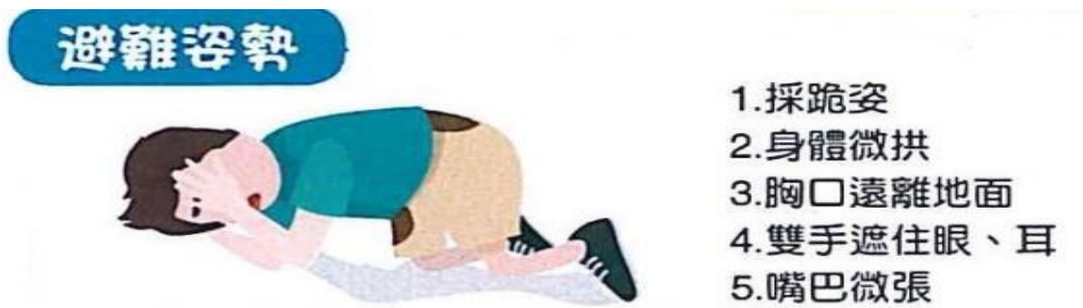
附圖：防空避難姿勢

(3)姿勢：背向窗戶或爆炸方向，盡量壓低身體，採跪或趴下姿勢，拱起身體胸口離開地面。以雙手遮住眼睛，姆指摀住耳朵，嘴巴微張如圖1（爆炸會產生強大推震力，震飛人車或造成無數飛濺破片，其次爆炸衝擊波不管有沒有牆壁等遮蔽物，都會對周遭產生瞬間壓力差，可能對人體造成耳膜破裂、眼球突出或內臟損傷等傷害）。