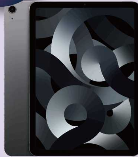
iPad Air 64G wifi版 1位