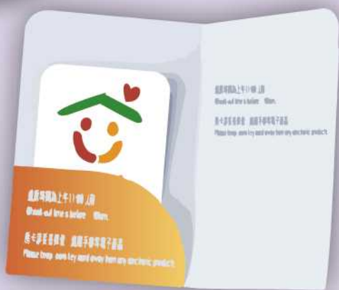
知名飯店住宿券 10位