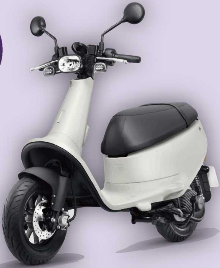
Gogoro VIVA 1位