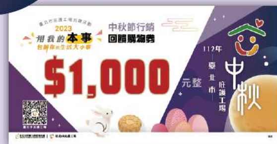
臺北市庇護工場1,000元購物金 10位