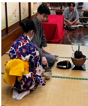
▲指導高中生點茶流程

利用與主教材內容相關題材做日本文化學習的角色扮演會話口語練習，本專班隨班一位兼任學習助理每月一次協助任課教師輔導高中生語言能力檢定練習。學期中也會安排日本文化體驗課程如日本茶道、和服講習。藉由本課程提供高中生第二外語進階學習和增廣國際觀的機會。