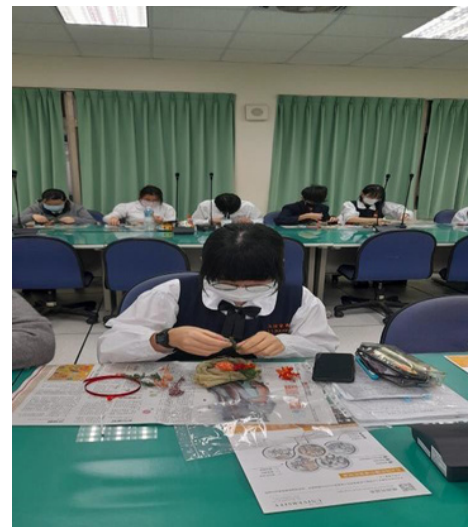
▲日本文化體驗-注連繩製作