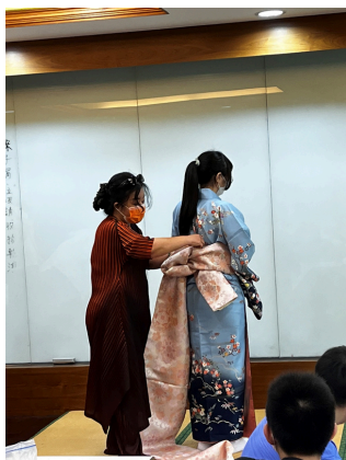
▲示範穿和服的技巧