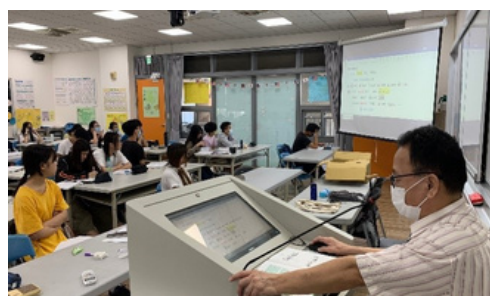
▲教師解說句型語法