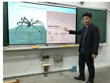
▲藝文展覽活動補充