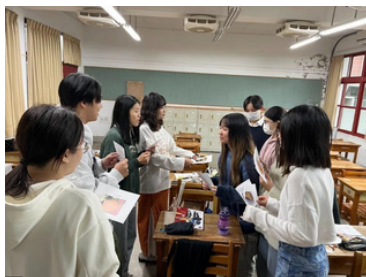
▲課堂練習食物單字