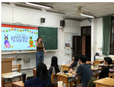
▲法籍助教介紹復活節文化