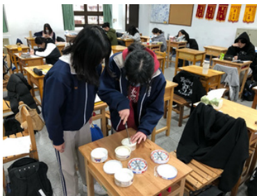
▲文化體驗活動 認識品嚐法國乳酪