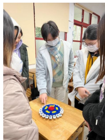
▲藉由遊玩桌遊複習單字