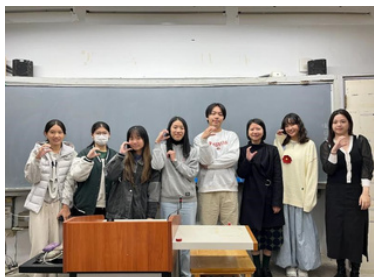
▲碩士班同學觀摩實習

本課程除了與輔仁大學西文系碩士班課程「西語教材教法」合作，連結大學與高中間的學習及互動外，也在課堂上讓學生透過口說練習、桌遊，加深學習效果。