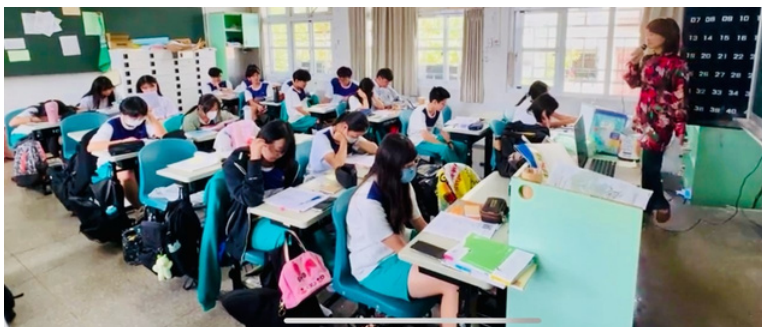
▲集體練習《Soulman》的剪影