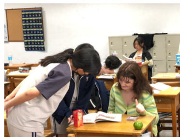
▲法籍助教口語練習